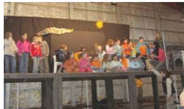
Alumnos esc. N° 298 y Jardín N° 44, cantando

"La existencia de las áreas protegidas habla de la riqueza de un país que planifica su futuro y desarrolla su presente. Por ello, los parques nacionales deben transformarse en instrumentos del desarrollo sustentable y como tales representar verdaderas oportunidades de crecimiento, trabajo y equidad social, dinamizadoras de las economías regionales". (Plan de gestión institucional para los Parques Nacionales, 2001).