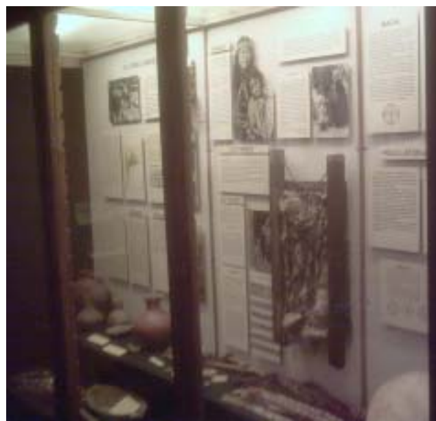
Sala de pueblos originarios

La Fundación Antorchas financió tres proyectos pre-