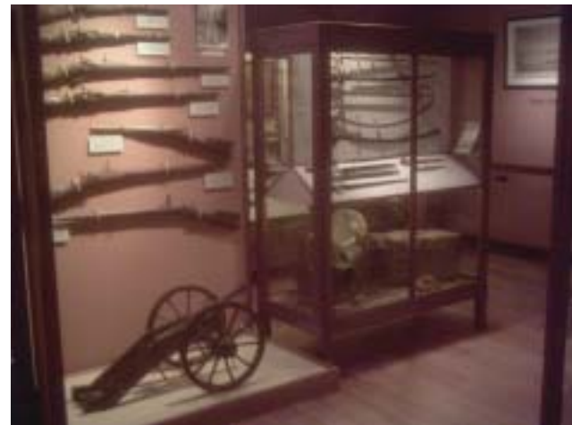
Sala de historia