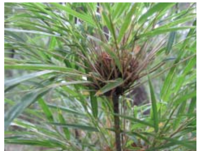
Detalle de caña Colihue