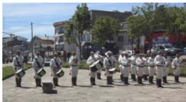
Banda Escuela Militar de Montaña

Fue en esa histórica fecha cuando el perito Francisco Pascasio Moreno donó 3 leguas cuadradas de tierra que el Estado le había otorgado por sus servicios prestados a la patria, para que allí se creara un Parque Público. Ese emblemático sitio que es el corazón del Parque Nacional comprende Puerto Blest, Lago Frías y Laguna Los Cántaros y