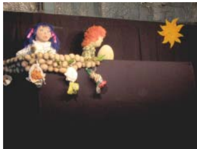
Títeres de "La Escalera"