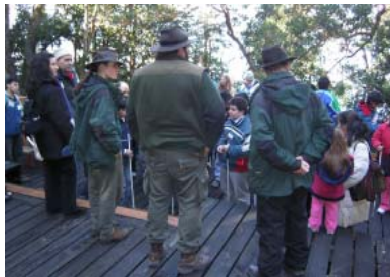
Guardaparques guiando a visitantes con capacidades diferentes en P. N. Los Arrayanes.

Durante el congreso, el Parque Nacional Nahuel Huapi puso de manifiesto el interés institucional y dió a conocer las tareas que se están realizando para lograr un turismo accesible. Asimismo destacó la importancia de trabajar en forma conjunta con el empresariado turístico y organizaciones civiles dedicadas a las personas con capacidades restringidas, con el fin de mejorar la prestación y calidad de los servicios. La experiencia fue recibida con gran interés dado que entre los países presentes aún no hay antecedentes de este tipo de trabajo conjunto que apunte a un turismo para todos.