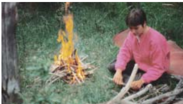
Cuidando el fogón

Para más información comunicarse con Fanny Haudet ( clif@apn.gov.ar ) Tel.: (02944) 430476