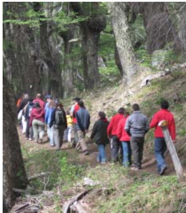
Sendero al Valle de los Perdidos

GENERALES: Previo a iniciar las actividades, consulte siempre al Guardaparque de la zona sobre la calidad del agua, sitios habilitados para acampar y/o hacer fuego, estado de los senderos, condiciones climáticas y las recomendaciones para realizar una visita segura.