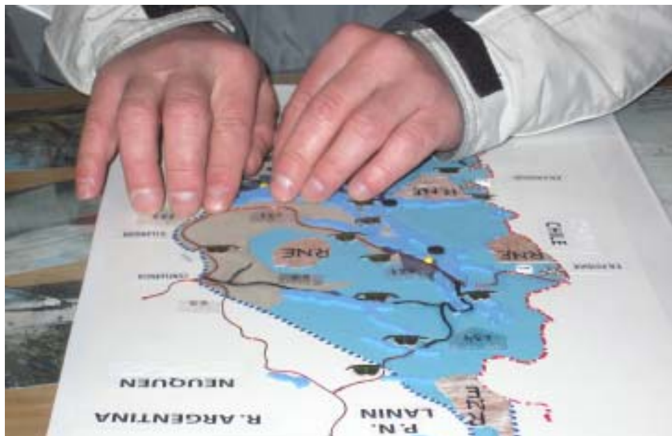
Visitante leyendo folleto del P. N. Nahuel Huapi en sistema Braille

Los visitantes de todo el mundo podrán acceder a las áreas protegidas para conocerlas y disfrutarlas.