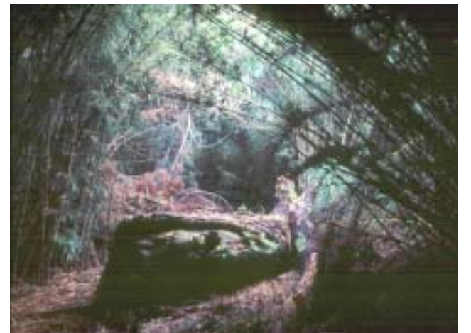
Sendero en cañaveral