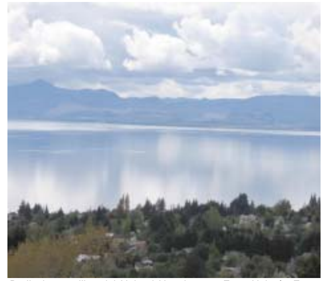
Bariloche a orillas del Nahuel Huapi

Esto se fortalecerá a través de la coordinación de políticas de conservación, intercambio de experiencias y conocimientos y formulación de estrategias conjuntas entre las partes involucradas.