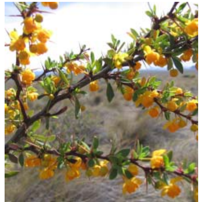
Calafate en la estepa