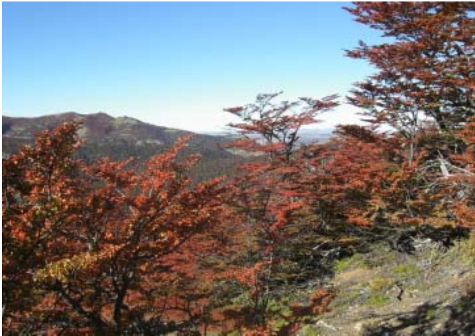
Vista desde laguna Verde

cuenta las pautas e instructivos ambientales oportunamente elaborados por la APN.