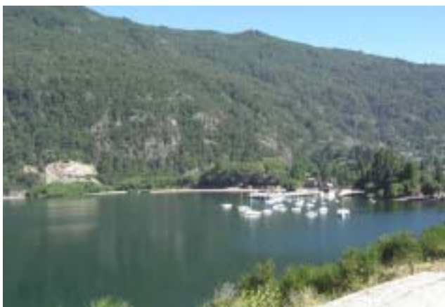
Lago Lácar, P. N. Lanín