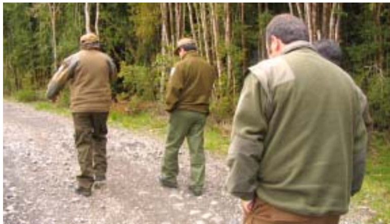
P. N. Puyehue - Chile